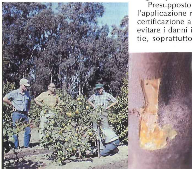
▲ Fig.2 - Deperimento causato dal viroide della cachessia (CVd IIb) in pianta innestata su C. macrophylla . Si notano impregnazioni di gomma a carico del portinnesto.

Facciamo riferimento, in particolare, al D. M. del 14 aprile 1997 riguardante le "Norme tecniche sulla commercializzazione dei materiali di moltiplicazione delle piante da frutto e delle piante da frutto destinate alla produzione di frutto" ed al D. M. del 29 ottobre 1993 sulle "Norme per la produ-