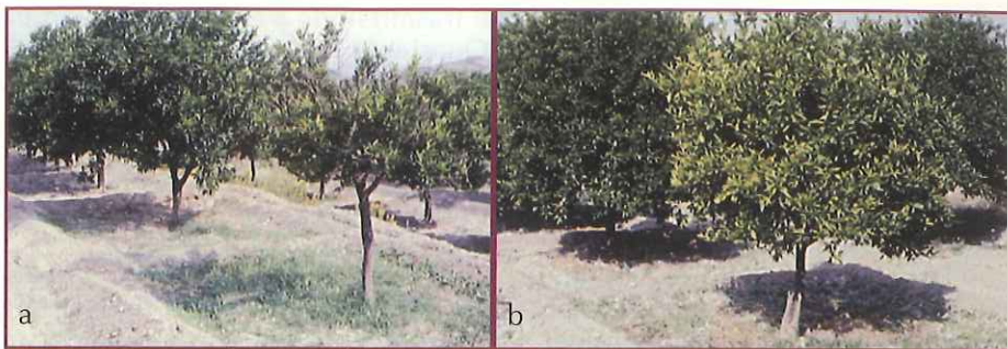
▲ Fig. 1- Clorosi, riduzione di sviluppo e deperimento in piante di clementine innestate su citrange Carrizo (a) e citrumelo (b) affette da viroidi diversi.

tie possono essere prevenuti in campo evitando l'accumulo di acqua, facilitando il drenaggio idrico, applicando fungicidi sistemici come il fosetyl-Al o il metalaxil, e utilizzando portinnesti resistenti. Quest'ultimo intervento gioca un ruolo chiave nel controllo della malattia soprattutto in ambienti poco favorevoli.